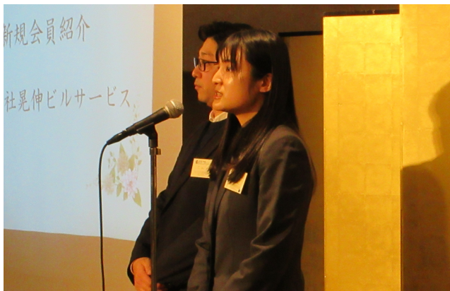
新加入企業(株)晃伸ビルサービス様 あいさつ

優良従業員表彰の後の会員交流会では、新規会員の紹介を含め、会員相互の親睦と連携をより深める機会となりました。