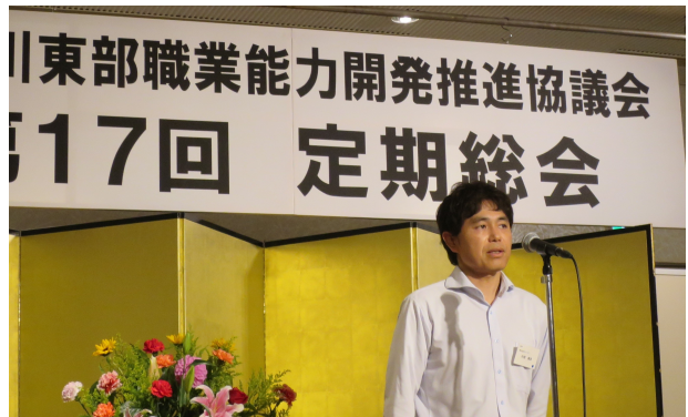
新加入企業(株)ユービー様 あいさつ