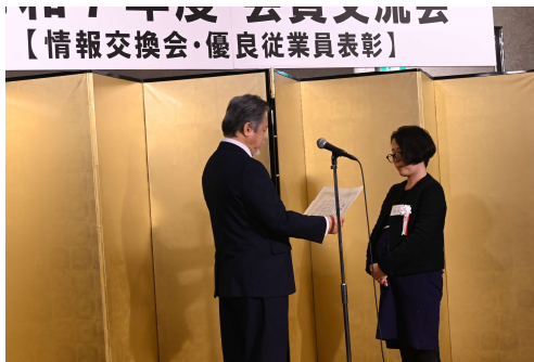
川瀬会長から表彰状の授与

優良従業員表彰は、協議会の会員企業に勤務する優れた従業員を顕彰し、本人の努力をたたえ、会員企業の一層の発展に資することを目的としており、今年度は、14名の方々が表彰されました。