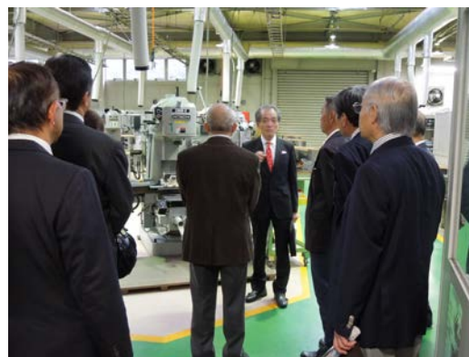
職業能力開発総合大学校長からの説明

18社、20名の会員が参加し、施設・設備や訓練内容を両校の校長自ら説明をされ、施設見学と意見交換を行い、改めて職業能力開発行政の理解を深めました。