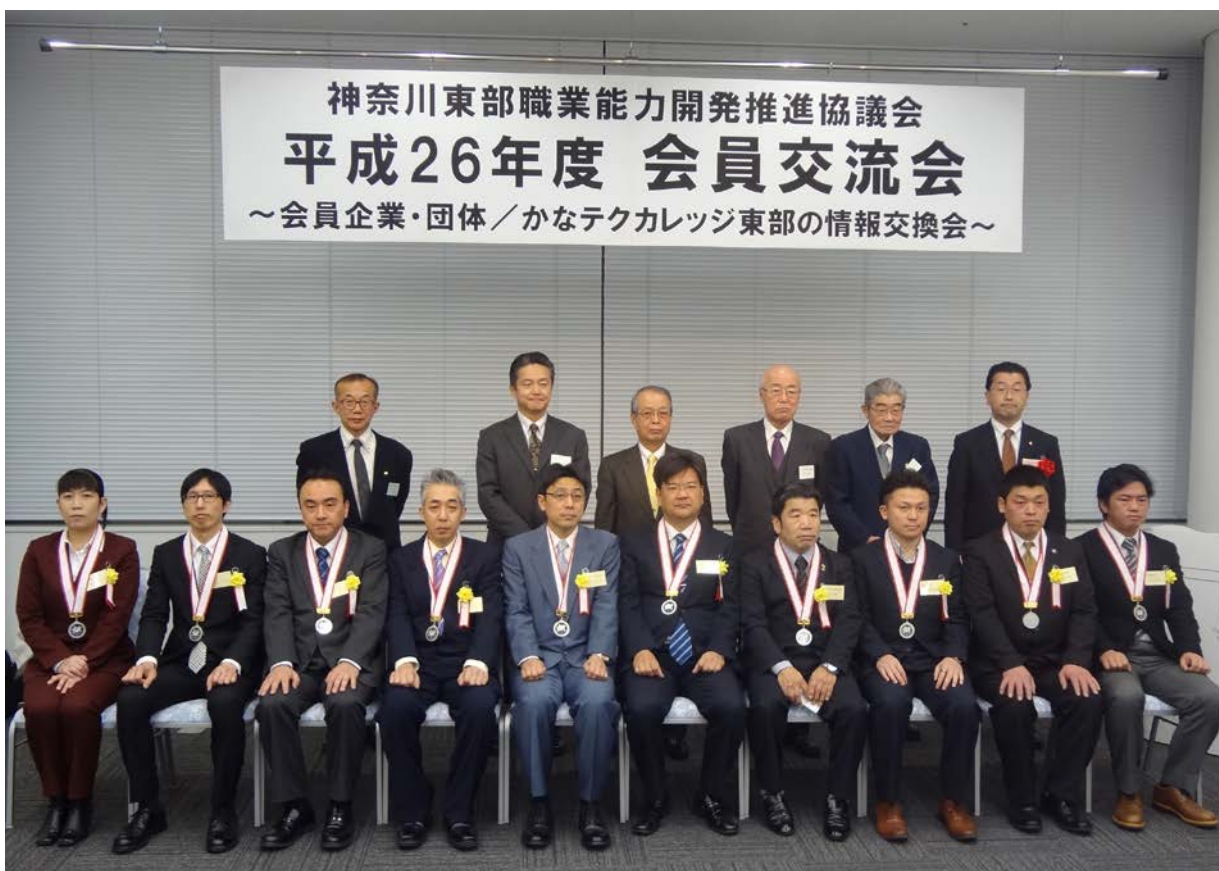
優良従業員表彰受賞者の皆様