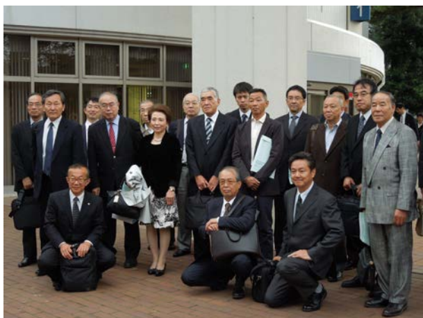
職業能力開発総合大学校